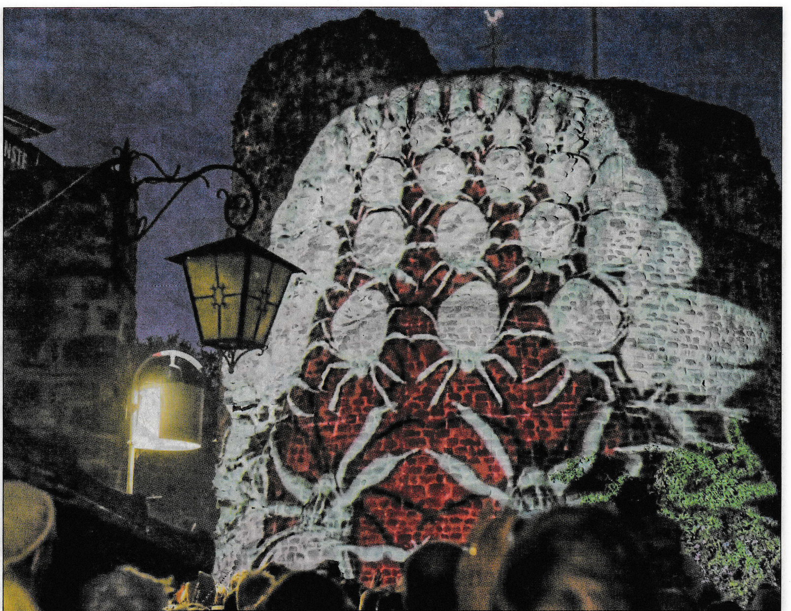
Für ihre „Lichtgespinste“ hat sich das Frankfurter Künstlerpaar vom morbiden Charme der Burgruine inspirieren lassen sowie ihren kleinen, großen und unbekanntem Bewohnern.

Das Ganze entstand anhand eines Computermodells des Gebäudes und einer speziellen 3D-Animationssoftware. Berücksichtigt werden muss-